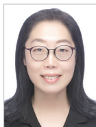
지도 | 어혜준