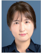
작곡 | 이명선