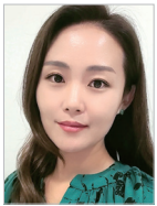
작사 | 조혜진