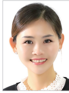
지도 | 정지은