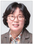
작사 | 한은선