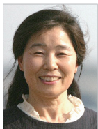
작사 | 김남숙