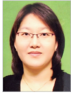
작곡 | 진영희