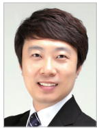
작곡 | 유경수