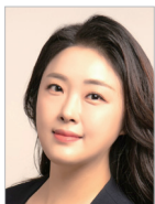
지도 | 임효주