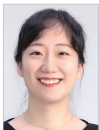
작사 | 박구슬