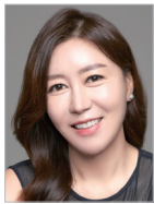
지도 | 장성경