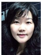
작사 | 전소영