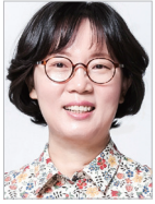
작사 | 한은선