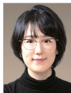
작곡 | 신혜경