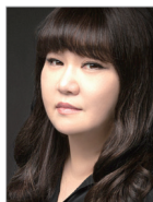
지도 | 홍계영