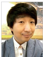
작사 | 김경구