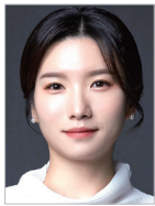
지도 | 이지현