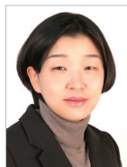
작곡 | 고수진