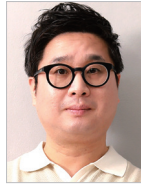
작사·작곡 | 이명진 지도 | 성일용