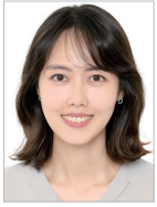
작사 | 심진하