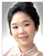
작곡 | 권미현