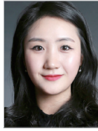
작사·작곡 | 이영재 지도 | 최재현