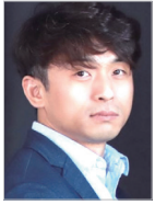
작사 | 이현수