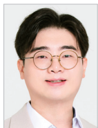
작곡 | 권혁준