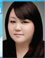
지도 | 홍계영