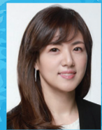
지도 | 추은지