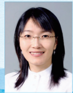
작곡 | 박선영