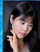
지도 | 백혜진