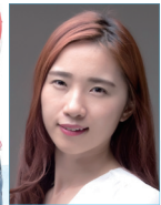
작사 | 한초롱