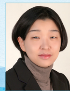
작곡 | 고수진