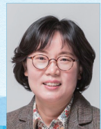
작사 | 한은선

두부는 부드럽고 고소해서 아이, 어른 할 것 없이 모두가 좋아하는 음식입니다. 콩을 이용해서 두부를 만드는 과정이 노랫말에 담겨 있는데 우리가 좋아하는 두부가 소재라서 재미있고 즐겁게 노래를 불렀습니다.