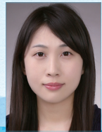
작곡 | 윤경미