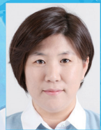
지도 | 방희정