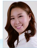
작사 | 김지원