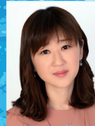
지도 | 차승현