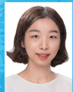
작곡 | 지도미 최유경