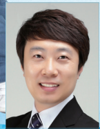
작곡 | 유경수