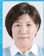
지도 | 방희정