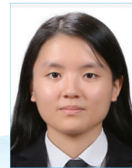
작사 | 방선우