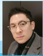
작곡 | 윤승철