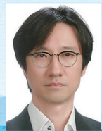
작사·작곡 | 이제희