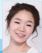
작곡 | 원미현