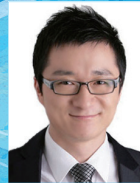
작사·작곡 | 채경록

불게 물든 노을을 배경으로 놀이터에서 깔깔대며 노는 아이들, 시간이 지나면서 점점 사라지는 노을을 보며 탄생한 신나고 재미있는 노을 노래입니다. 노을동요제에서 신나고 경쾌하고 멋진 동요를 들려드리겠습니다.