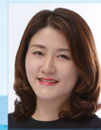
작곡 | 이성혜