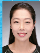
지도 | 이혜준