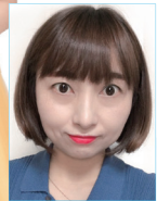
작사 | 윤경아