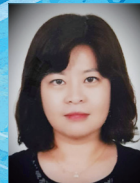
작사 | 최형심

우리들은 동요를 부를 때 제일 기분이 좋아지고 행복 해집니다. 이 즐겁고 행복한 마음을 '노을동요제'에서 예쁜 노랫말과 아름다운 멜로디로 많은 사람들과 함 께 나누고 싶어 참가하게 되었습니다.