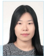
작사 | 오선희