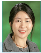
작사 | 박은희