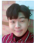
작사 | 김명우